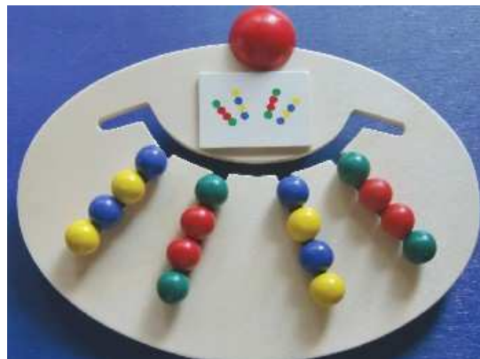
Tavola individuale di attività motoria in legno (cm. 28 x 19) con 4 labirinti su cui far scorrere le 16 palline colorate in legno (non estraibili) secondo gli schemi suggeriti dalle 16 schede allegate. <BR>L'obbiettivo del gioco è - da una parte - allenare il coordinamento oculo-manuale e - dall' altra - consolidare il riconoscimento dei colori, i concetti topologici ed avviare al ragionamento logico.